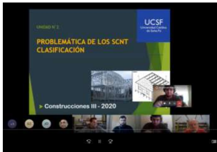
Clase virtual sincrónica de Construcciones III (FA UCSF) Plataforma MS Teams

Cabe aclarar que, si se trata del momento de inicio del primer encuentro, cobra especial importancia la utilización de alguna estrategia de presentación y “ diagnóstico ” del grupo, es decir, el planteo de alguna propuesta que permita recoger información acerca de las “características” del grupo. Esta información resulta valiosa luego, para la selección de las modalidades de enseñanza y el planteo de las consignas de actividades y de evaluación.