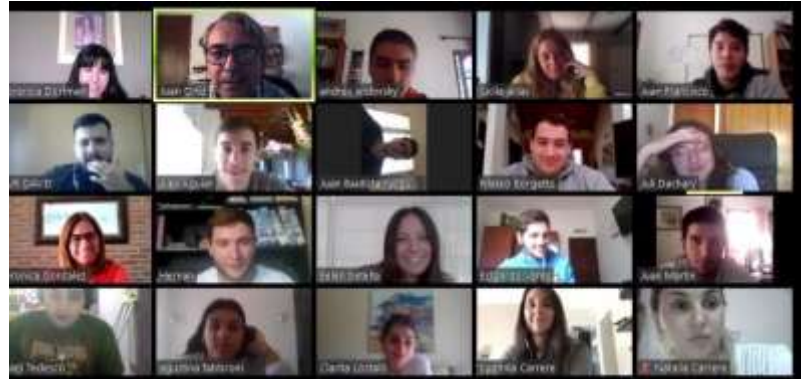
Clase virtual sincrónica de Historia de la Arquitectura I (FA UCSF) Plataforma Zoom Meeting